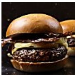
חדשה פה, בהמבורגר? מכבי 7.9