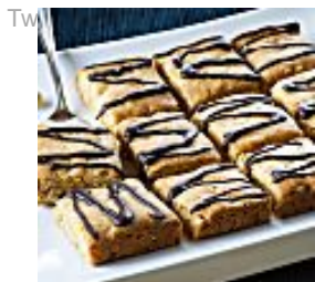
עוגיות חלבה קלות הכנה (השף הלבן)