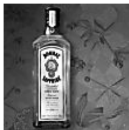
60 קראט בייבי: 'בומביי ספיר' ג'ין